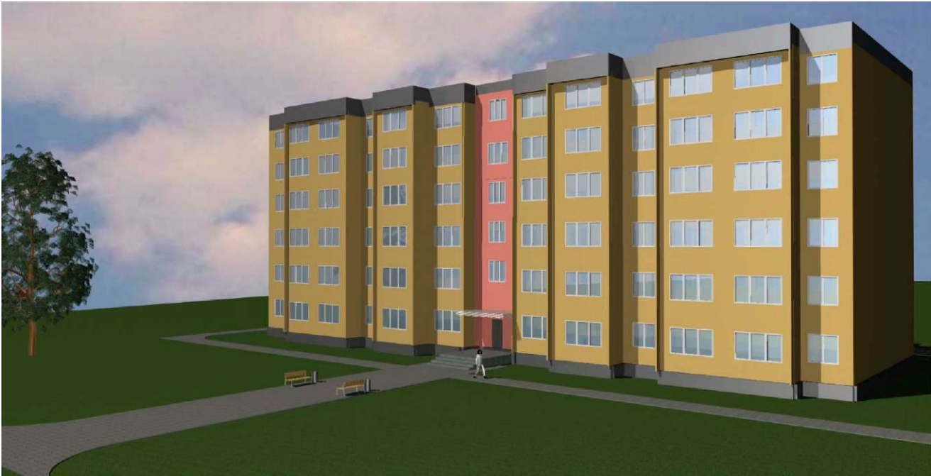
3-D Визуализация. Вид 1