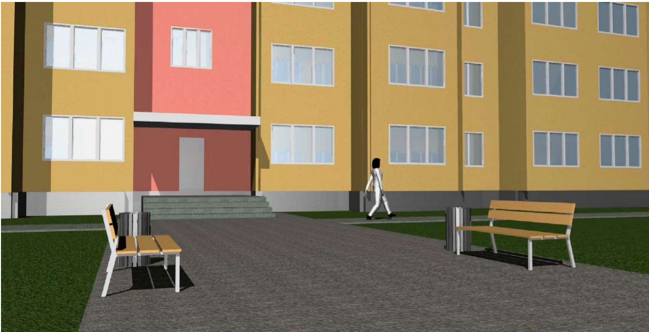
3-D Визуализация. Вид 3