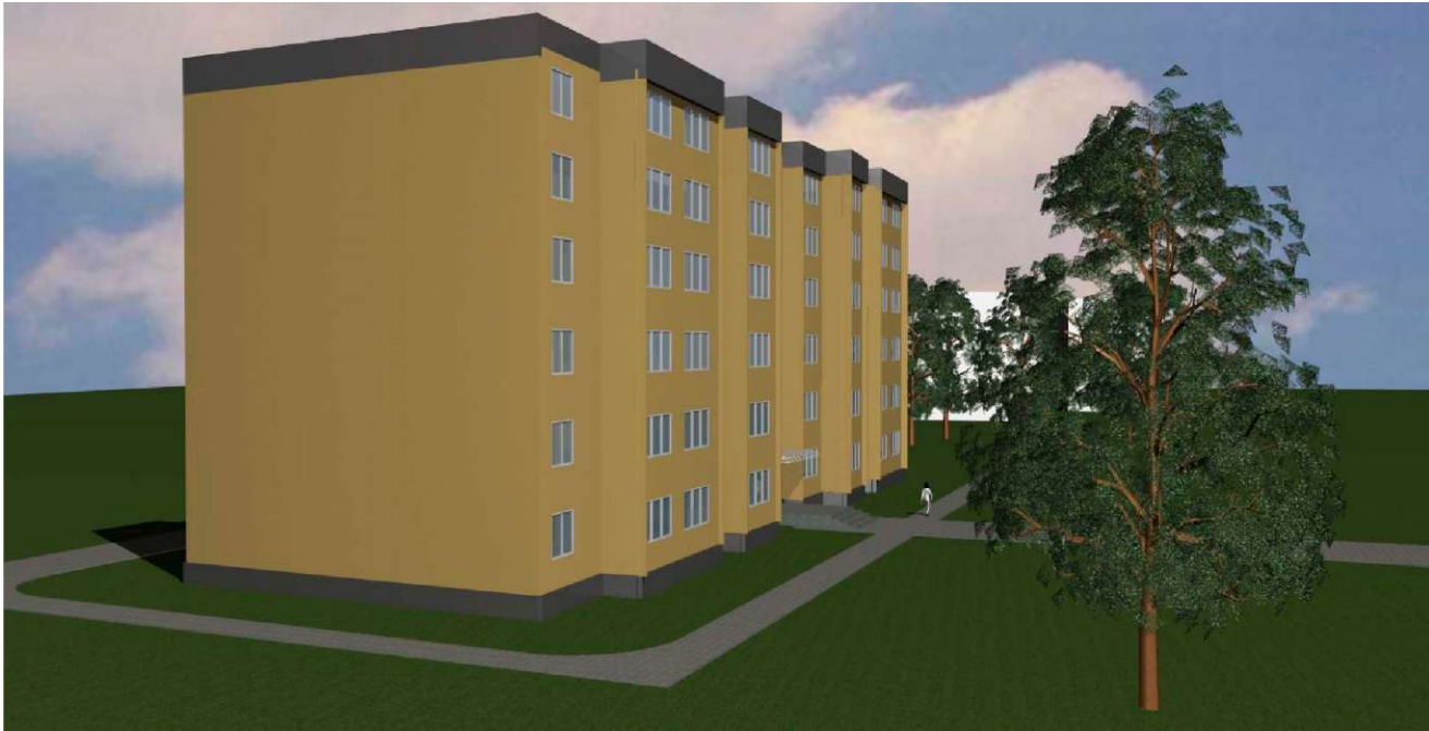
3-D Визуализация. Вид 2