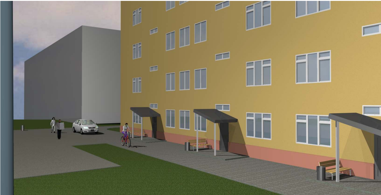
3-D визуализация. Вид 3