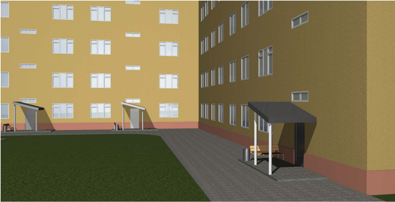
3-D визуализация. Вид 2