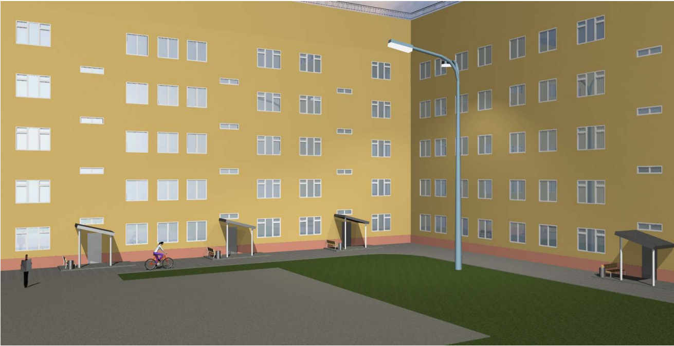
3-D визуализация. Вид 1