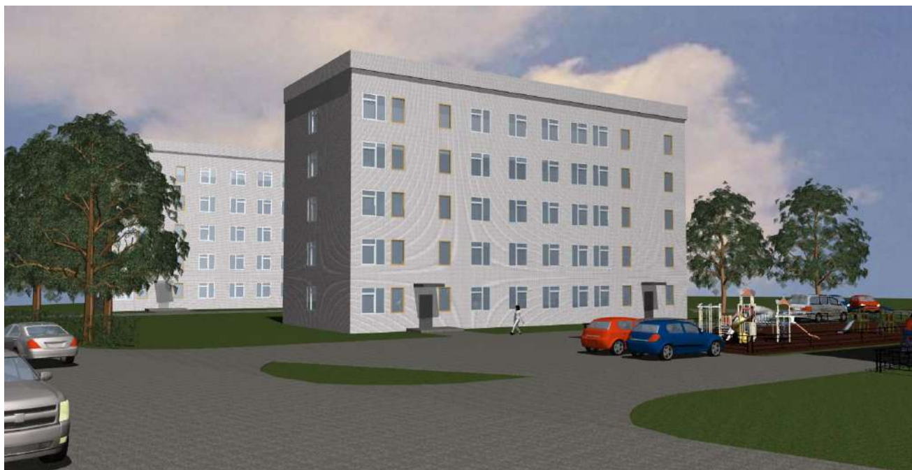
3-D визуализация. Вид 6