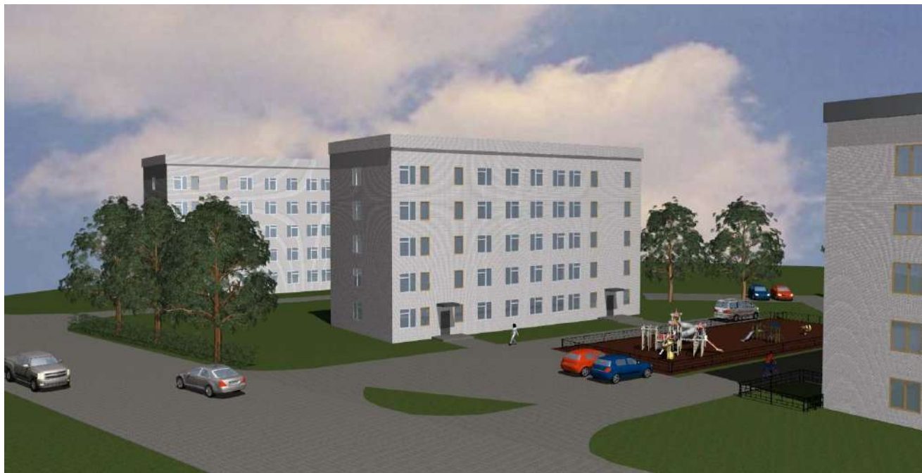
3-D визуализация. Вид 1