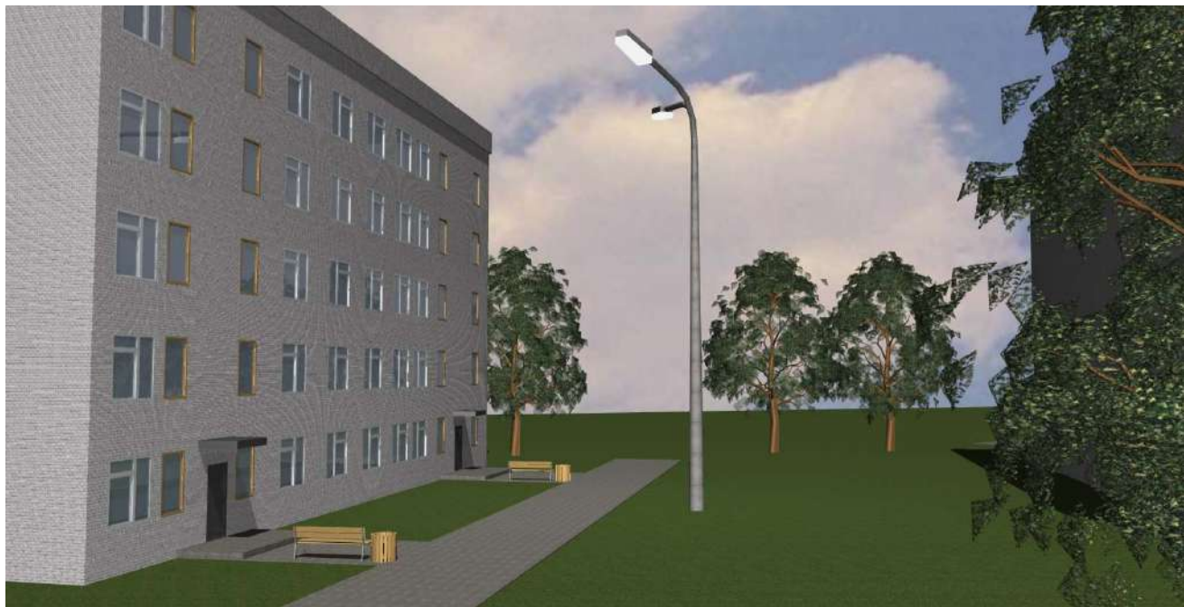
3-D визуализация. Вид 2