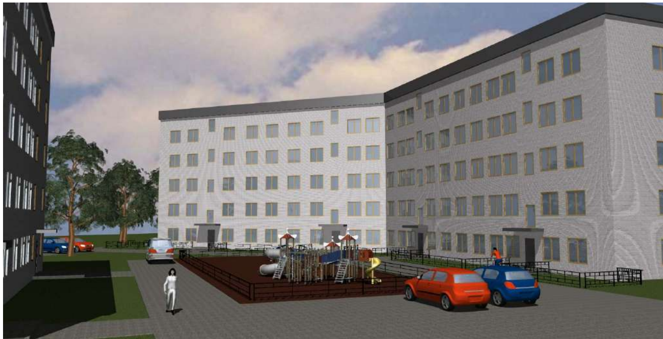
3-D визуализация. Вид 3