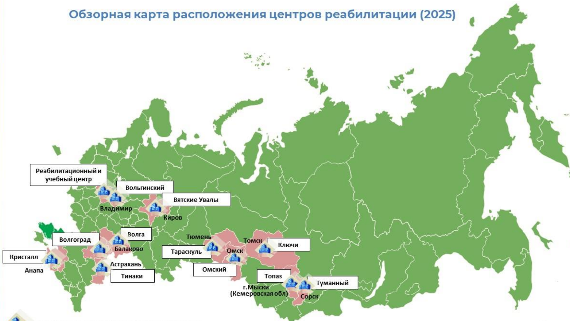
Обзорная карта расположения центров реабилитации (2025)